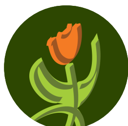
Roel Stam Tuinonderhoud