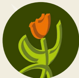
Chinouk Lathouwers Pedagogisch medewerker